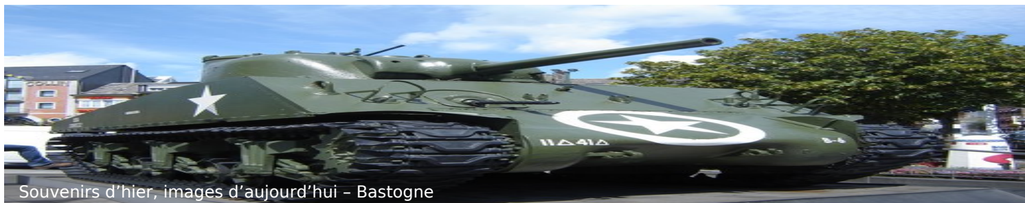
Souvenirs d'hier, images d'aujourd'hui - Bastogne