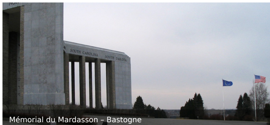
Mémorial du Mardasson - Bastogne

Ce guide vous aide à préparer votre week-end : itinéraires, cérémonie, et conseils pratiques.